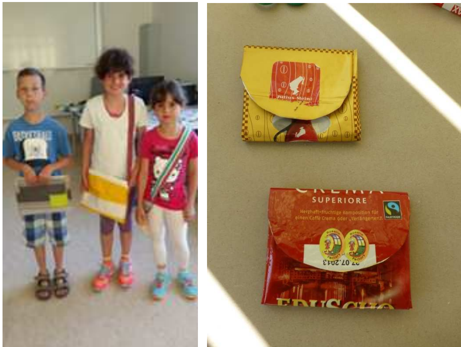
Es gab auch Geldtaschen aus Kaffeeverpackungen