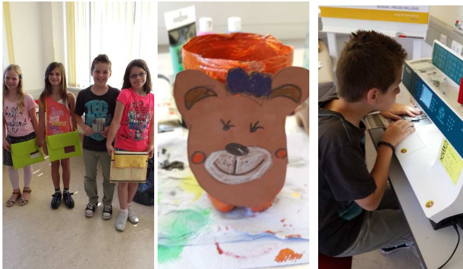
Auch andere Dinge aus wertlosem Material konnten hergestellt werden